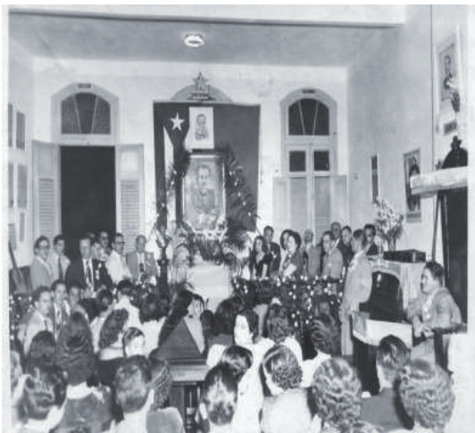
Imagen de una de las veladas realizadas por las logias de la ciudad de Camagüey para conmemorar el 28 de enero.